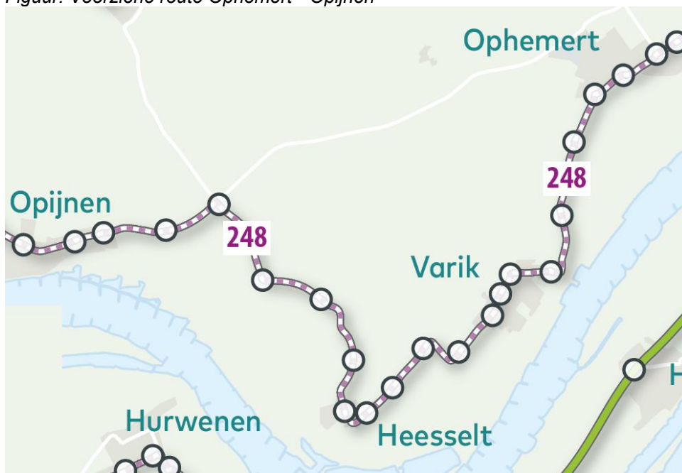
Figuur: Voorziene route Ophemert - Opijnen

g. Realiseerbaarheid: De voorziene wijziging Ophemert - Varik is realiseerbaar na heropening van de Waalbandijk (verwacht medio eind maart/begin april). De voorziene wijziging Varik - Opijnen is onder voorbehoud van het realiseren van afdoende rijtijd door de wijziging van Ophemert - Varik.